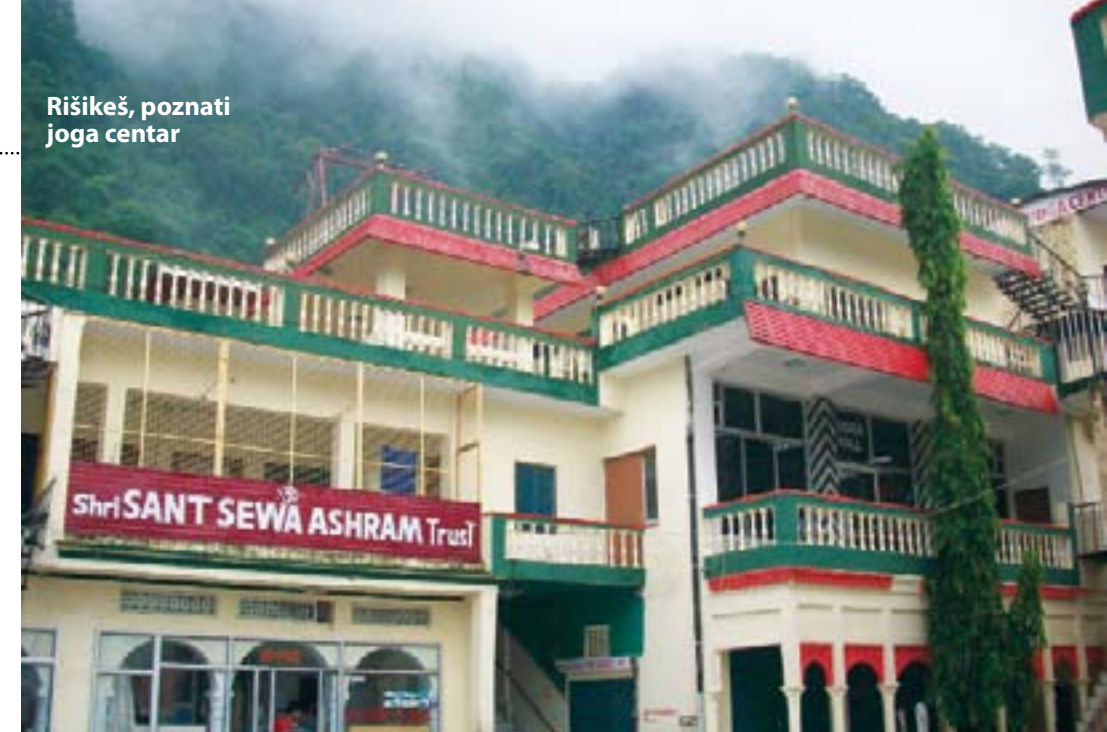
Rišikeš, poznati joga centar

Granica između naša dva sveta je pitanje kulturološkog obrasca. U suštini, svi mi jesmo ono u šta verujemo. Uz zalazak sunca iz ašhrama se razliva najlepša hindu muzika, isprekidana zvucima zvona. Preko dana suva, zemlja polako postaje vlažna, zelenilo poprima tamne, zagasite nijanse, vrhovi Himalaja ostaju zarobljeni u snežnoj magli. U jednom od mnogih uslužnih kafea, na terasi natkriljenoj nad samu reku, sedim, pijem čaj i ponavljam: „Ovo je magija. Ako se sada i ovde, pred mojim očima, sve ove planine ispomeraju - neću trepnuti. Znaću da je to jezik tajne. Jezik Indije“.