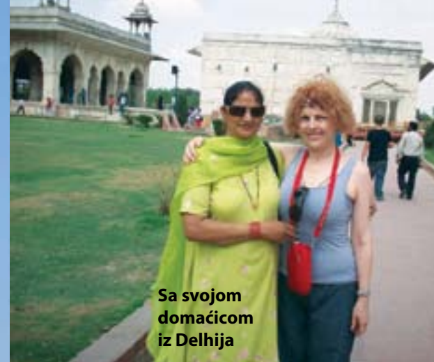
Sa svojom domaćicom iz Delhija

Spoj mogulske istorije sa evropskom, siromaštva sa bogatstvom, religije sa jogom - harmonija različitosti, čuvanje tradicije i podsetnik da je ova zemlja dugo bila britanska kolonija. Kada zađete u u srce grada, očekuje vas iznenađenje. To je mala Indija u velikoj! Tu se odvija potpuno drugačiji život koji gotovo da